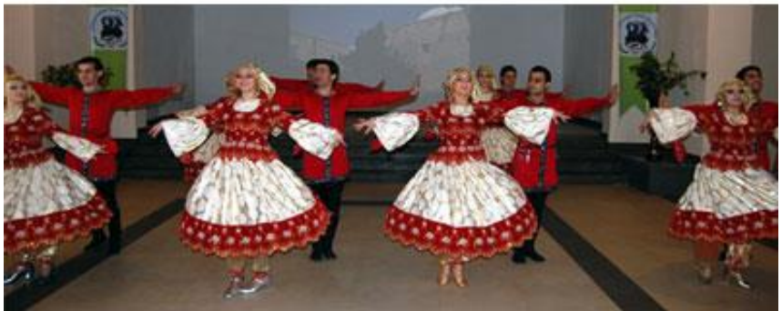
«Halay» rəqs ansamblı